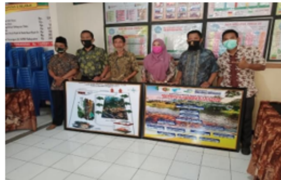
Figure 4. Kerja sama BUMDES Sumber Lestari bersama UNITOMO