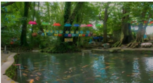
Figure 1. Objek Wisata Sumber Dhuwur

Dalam hal ini, pariwisata harus dianggap sebagai industri yang memberikan kontribusi bagi pembangunan ekonomi dan sosial, baik di negara maju maupun negara berkembang. Indonesia merupakan negara kepulauan dengan potensi besar di sebagian besar industri, termasuk pariwisata. Industri pariwisata di Indonesia memerlukan perhatian khusus dari pemerintah baik pusat maupun daerah untuk mempromosikan potensi wisata. Perkembangan pariwisata itu sendiri mempunyai pengaruh yang kuat terhadap mengembangkan kawasan sekitar destinasi wisata, karena dapat berperan sebagai industri utama, khususnya industri yang dapat meningkatkan perekonomian daerah. Tujuan dari pemerintah desa membangun Objek Wisata Sumber Dhuwur yaitu untuk meningkatkan kesejahteraan masyarakat dalam bidang ekonomi, sosial maupun budaya, untuk memajukan desa agar terlepas dari ketertinggalan juga dikenal banyak orang serta bertujuan untuk menggerakkan para pemuda agar aktif dan terlepas dari pengangguran. [4]