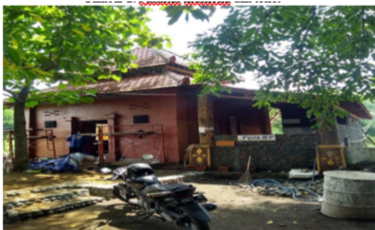
Figure 3. Fasilitas musholla dan toilet