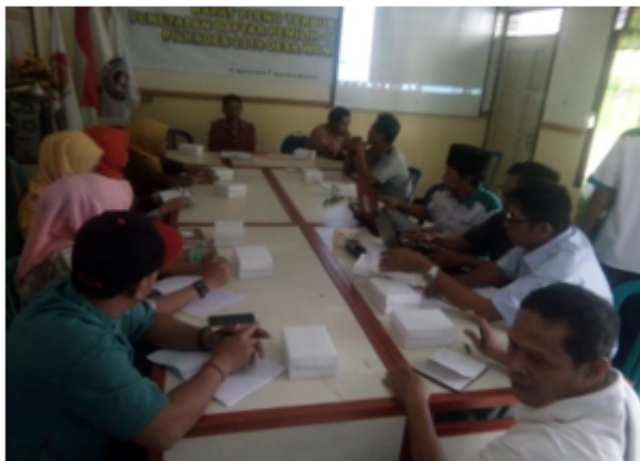
Figure 5. Proses evaluasi yang dilakukan oleh pengelola Sumber Dhuwur