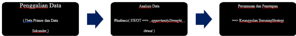
Figure 1. Alur penelitian yang dilakukan peneliti dalam penelitian ini :

5) Kalender Pendidikan Sekolah Menengah Atas (SMA) Taman Harapan, Malang.