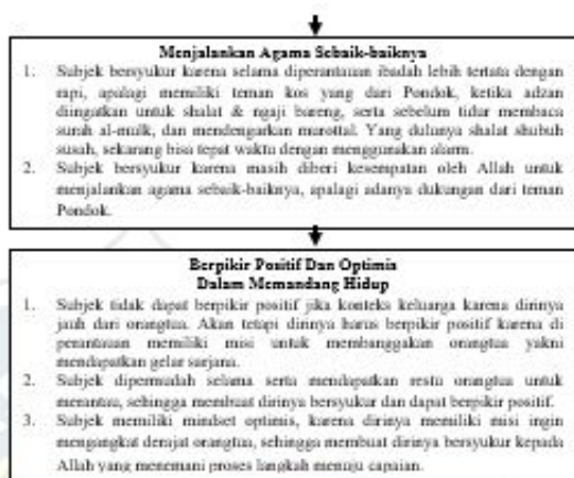
Figure 3. Perbandingan Analisa Data Subjek II