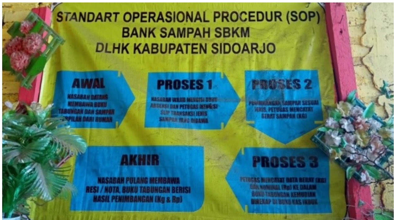
Figure 2. Alur menabung di Bank Sampah Berkah

Penerapan (implementasi) mengarah pada kegiatan, tindakan, tindakan atau adanya mekanisme suatu sistem untuk melakukan kegiatan bukan hanya suatu operasi, namun kegiatan yang direncanakan, dan untuk pencapaian suatu kegiatan yang telah direncanakan [12], sedangkan Menurut Setiawan (2004) penerapan adalah suatu perluasan kegiatan yang mengatur satu sama lain dalam interaksi antara tujuan dan tindakan untuk mencapainya dan memerlukan jaringan pelaksana, birokrasi yang efisien [13]. Sama seperti halnya pada program Bank Sampah Berkah di Desa Kepuh Kemiri. Selain itu Bank Sampah Berkah telah memiliki ijin dari Pemerintah Desa Kepuhkemiri dalam penerapannya, dibuktikan dengan adanya SK No. 36 Tentang Pengelolaan Bank Sampah "Berkah" Desa Kepuhkemiri Kecamatan Tulangan Kabupaten Sidoarjo pada tahun 2019. Bank Sampah Berkah juga dalam penerapannya telah sesuai dengan SOP yang berlaku dari DLHK Kabupaten Sidoarjo.