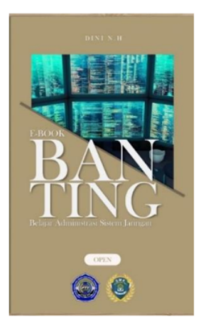
Gambar 2. Halaman Awal

Halaman awal berisi nama media dan mata pelajaran dengan tujuan agar siswa dapat mengetahui pelajaran apa yang akan dipelajari pada E-Book tersebut. Halaman awal ditunjukkan pada Gambar 2.