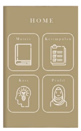
Gambar 3. Halaman Home

Halaman home terdapat beberapa pilihan menu diantaranya terdapat menu materi, kesimpulan, kuis dan profil. halaman Home ditunjukkan pada Gambar 3.