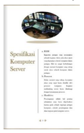
Gambar 4. Halaman Materi

Halaman materi terdapat kumpulan materi yang akan dibahas pada pembelajaran yang disesuaikan dengan isi KI/KD yaitu mencakup materi DHCP server. Halaman materi ditunjukkan pada Gambar 4.