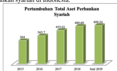
Gambar 1 Pertumbuhan Total Aset Perusahaan Perbankan Syariah

Perbankan syariah merupakan bank dengan asas keadilan, kemitraan, universal serta transparansi dalam setiap aktivitas usaha [1]. Pertumbuhan bank umum syariah di Indonesia begitu pesat dan dibuktikan dengan data Otoritas Jasa Keangan (OJK) pada Juni 2018 tercatat Bank Prekreditas Syariah (BPRS) mencapai 168 bank, Unit Usaha Syariah (USS) mencapai 21 unit, dan Bank Umum Syariah (BUS) mencapai 13 bank. Berikut data perkembangan total aset perbankan syariah di Indonesia: