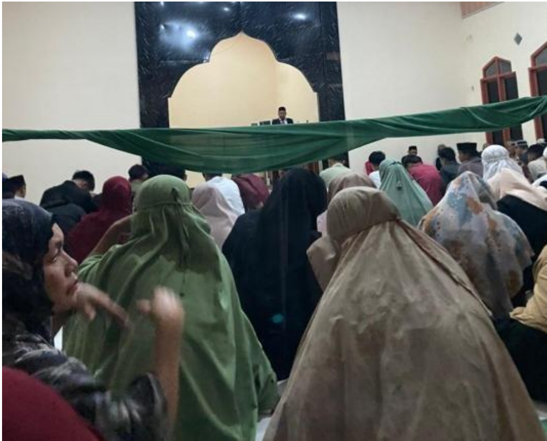
Figure 2. Sosialisasi Tokoh Agama

kesempatan, baik di mimbar khutbah maupun kegiatan pengajian, kami menyampaikan pesan untuk menjaga ukhuwah dan saling menghormati satu sama lain.”