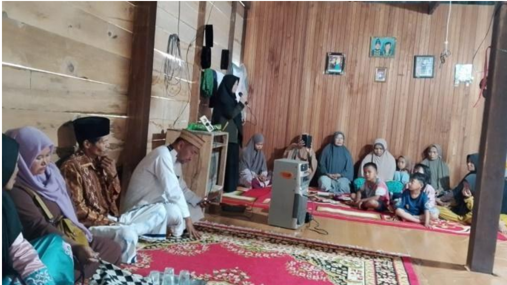
Figure 1. Pengajian Bulanan Dusun Mendeng

persuasif dan tidak menghakimi. Pendekatan ini bertujuan menumbuhkan kesadaran bahwa konflik politik bersifat sementara, sedangkan hubungan sosial dalam masyarakat harus dipertahankan.”