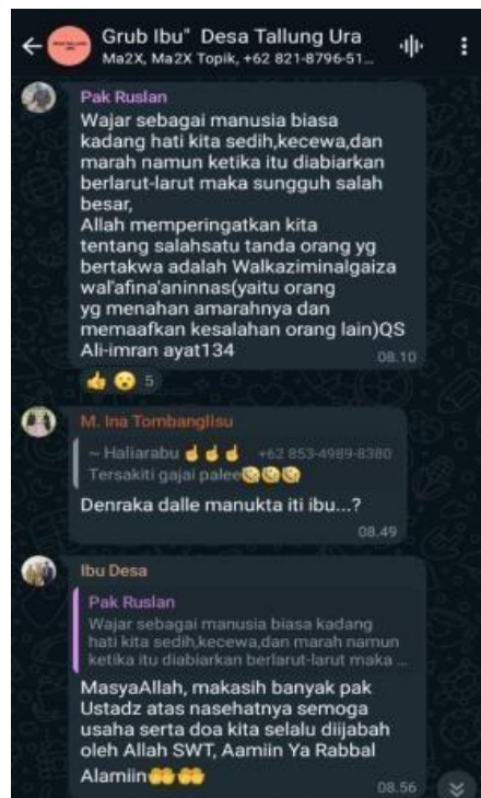
Figure 3. Grup WhatsApp Desa Tallug Ura

Media sosial memiliki peran signifikan dalam memperkuat mekanisme komunikasi pasca Pilkada di Desa Tallung Ura.